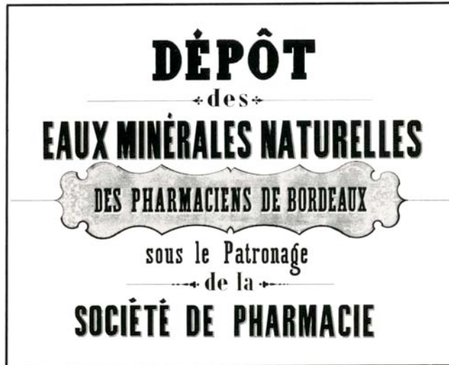
Affiche signalant un dépôt d'eaux minérales naturelles établi sous l'égide de la Société de Pharmacie de Bordeaux.